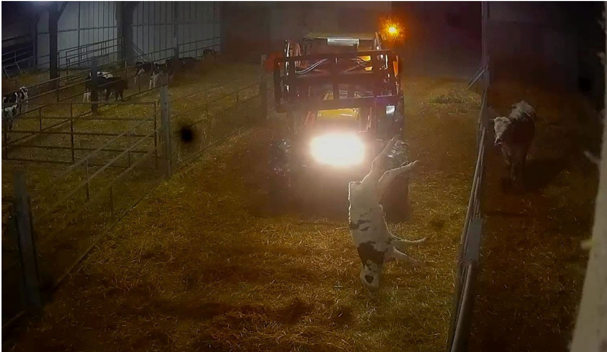
Veau euthanasié à l'arrivée au centre de transit de Cherbourg

que « nul ne transporte ou ne fa[sse] transporter des animaux dans des conditions telles qu'ils risquent d'être blessés ou de subir des souffrances inutiles 42 ».