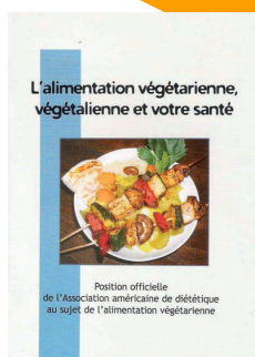
44 pages, 3€

Besoin d'information sur une alimentation savoureuse et équilibrée sans produits animaux ? Le site et la boutique de L214 mettent des ressources à votre disposition